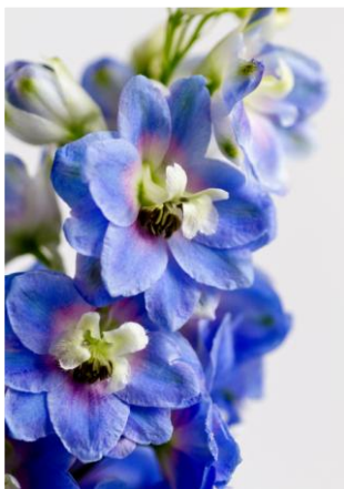
図 1 青色デルフィニウム

Nishizaki, Y., Yasunaga, M., Okamoto, E., Okamoto, M., Hirose, Y., Yamaguchi, M., Ozeki, Y and Sasaki, N. (2013) p -hydroxybenzoyl-glucose is a “zwitter donor” for the biosynthesis of 7-polyacylated anthocyanin in delphinium ( Delphinium grandiflorum ). Plant Cell 2013 (DOI: 10.1105/tpc.113.113167)